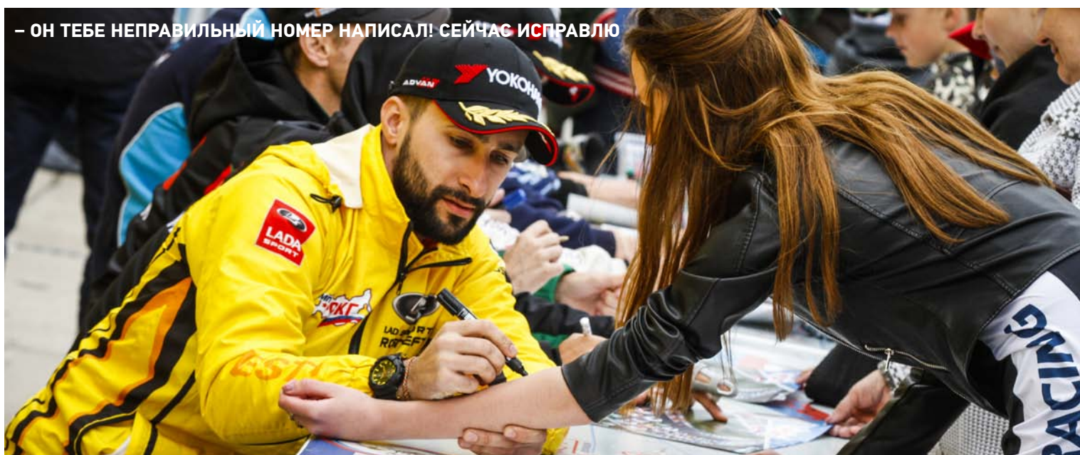
– ОН ТЕБЕ НЕПРАВИЛЬНЫЙ НОМЕР НАПИСАЛ! СЕЙЧАС ИСПРАВЛЮ