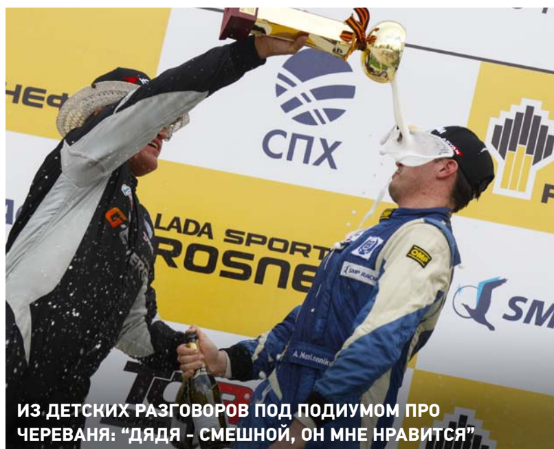
ИЗ ДЕТСКИХ РАЗГОВОРОВ ПОД ПОДИУМОМ ПРО ЧЕРЕВАНЯ: «ДЯДЯ - СМЕШНОЙ, ОН МНЕ НРАВИТСЯ»