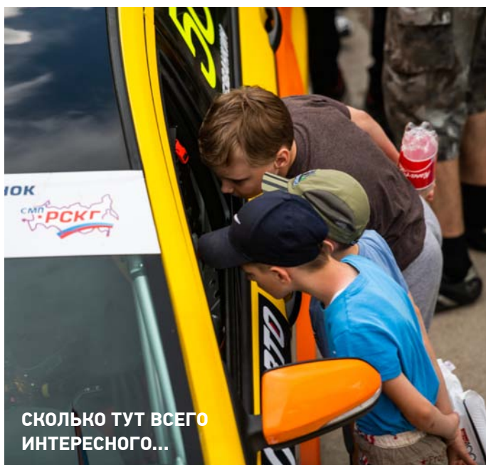
СКОЛЬКО ТУТ ВСЕГО ИНТЕРЕСНОГО...