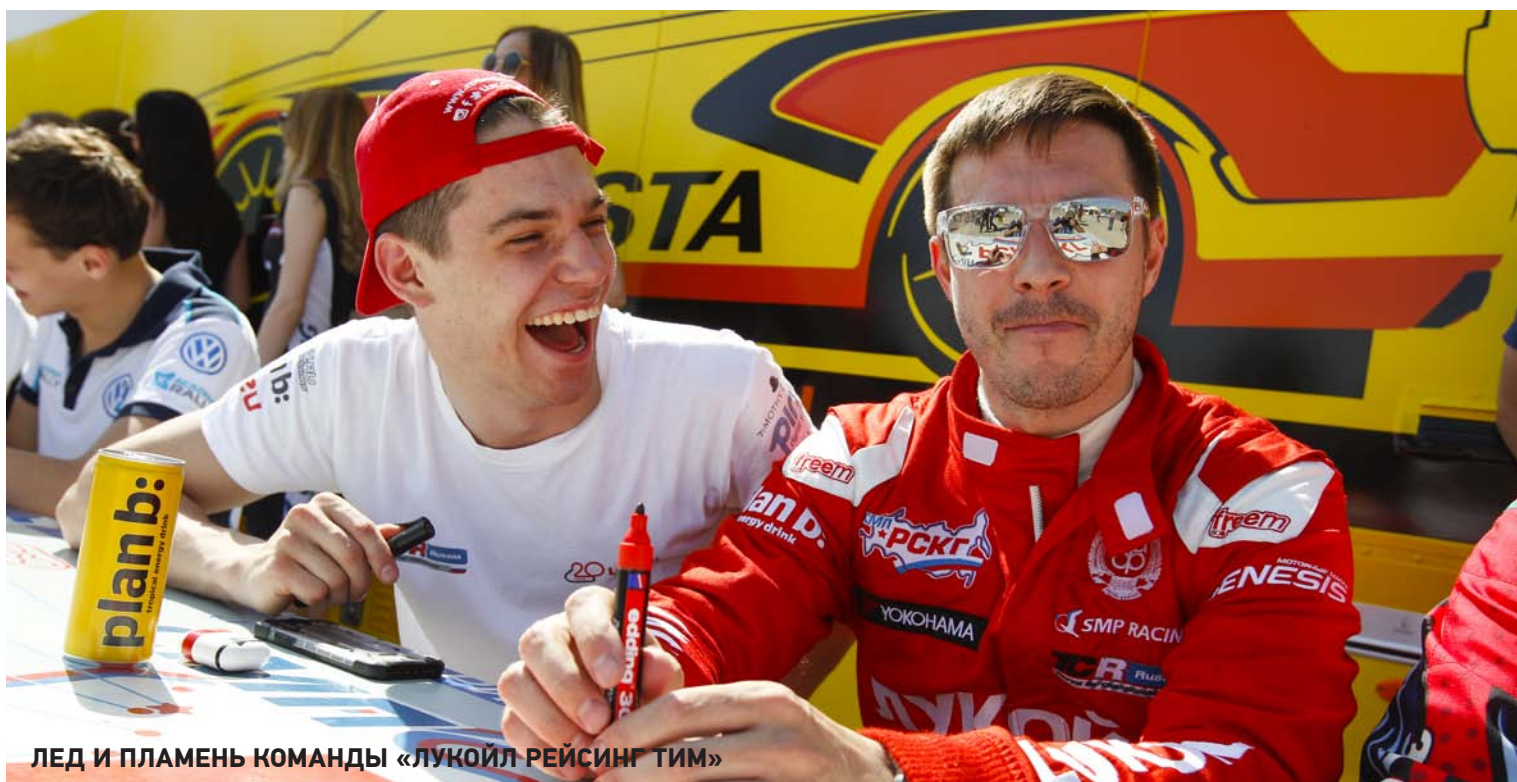
ЛЕД И ПЛАМЕНЬ КОМАНДЫ «ЛУКОЙЛ РЕЙСИНГ ТИМ»